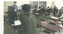
データを活用したスマート農業の取組（高知大学）

地域産業・若者雇用の創出や、地元企業や地方公共団体と連携した地方大学の取組を促し、大学を核として地方活性化が図られるような地域づくりを目指す。