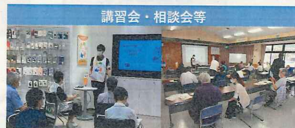
令和3年度デジタル活用支援推進事業（総務省）における講習会等の様子