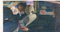
MaaSアプリを利用したタクシー配車（群馬県前橋市）

地域住民等の移動ニーズに対応して、複数の公共交通やそれ以外の移動サービスを組み合わせる検索・予約・決済等を一括して行うMaaSを実装し、移動の利便性向上等が図られたまちづくりを目指す。