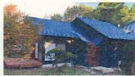
ワーケーション可能な農泊施設（イメージ）

中山間地域の基幹産業である農林漁業の「仕事づくり」を軸として、豊かな自然、魅力ある多彩な地域資源・文化等やデジタル技術の活用により、活性化を図る地域づくりを目指す。