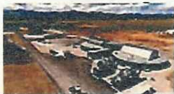
スマートなまちづくりプロジェクト（北海道上士幌町）

地方活性化に取り組むに当たり、SDGsの理念を取り込むことで、政策の全体最適化や地域課題の解決の加速化という相乗効果を生み出し、未来志向で持続可能な地域づくりを目指す。