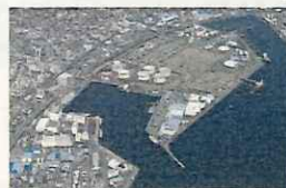
太陽光発電と大型蓄電池によるマイクログリッド（静岡県静岡市）

2030年度までに民生部門の電力消費に伴うCO 2 排出実質ゼロを実現するにあたり、デジタル技術も活用して脱炭素化に取り組み、地域課題の解決につなげる地域づくりを目指す。