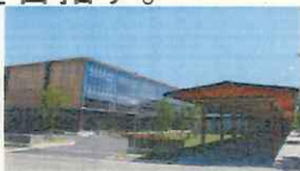
スマートシティAiCT（福島県会津若松市）

データ連携基盤などのデジタルやAI、IoTなどの未来技術を活用して、地域の抱える様々な課題を高度に解決することにより、新たな価値を創出し、持続可能な地域づくり・まちづくりを目指す。